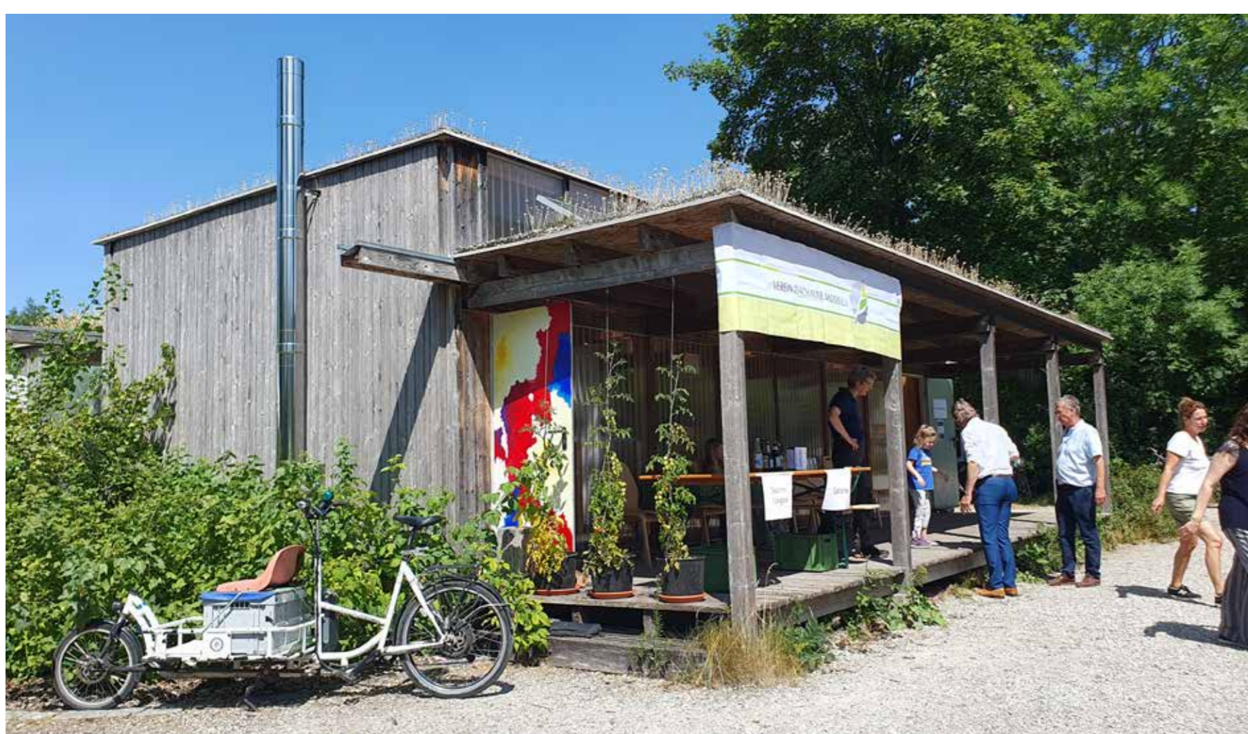
Unser Umwelthaus mit Lehrgarten, Backofen und Seminarraum