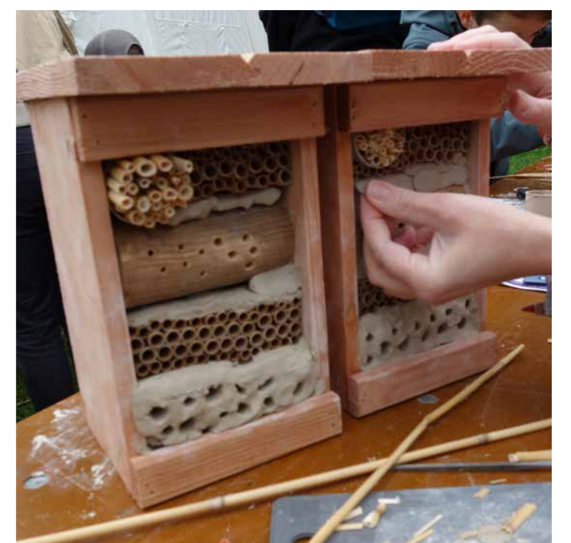
Das Basteln von Insektenhäusern ist der Renner in unserem Programm.