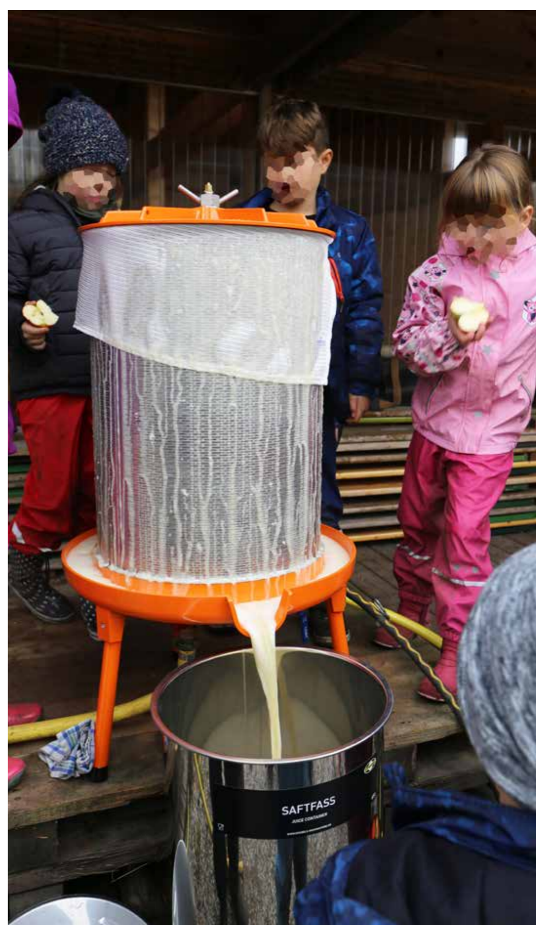
Vom Apfel zum Saft mit unserer Presse