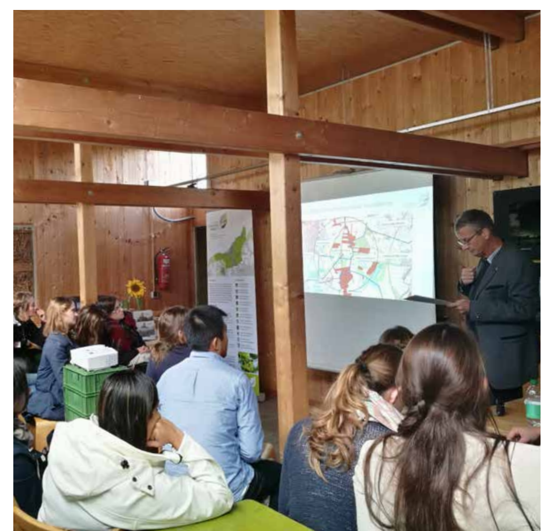
In unserem Seminarraum finden bis zu 30 Personen Platz.