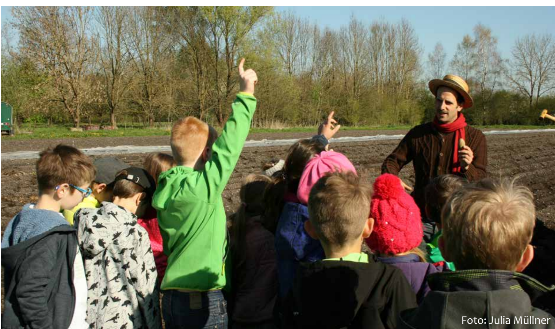
Hier können die Kinder Lehrplanthemen hautnah erleben.