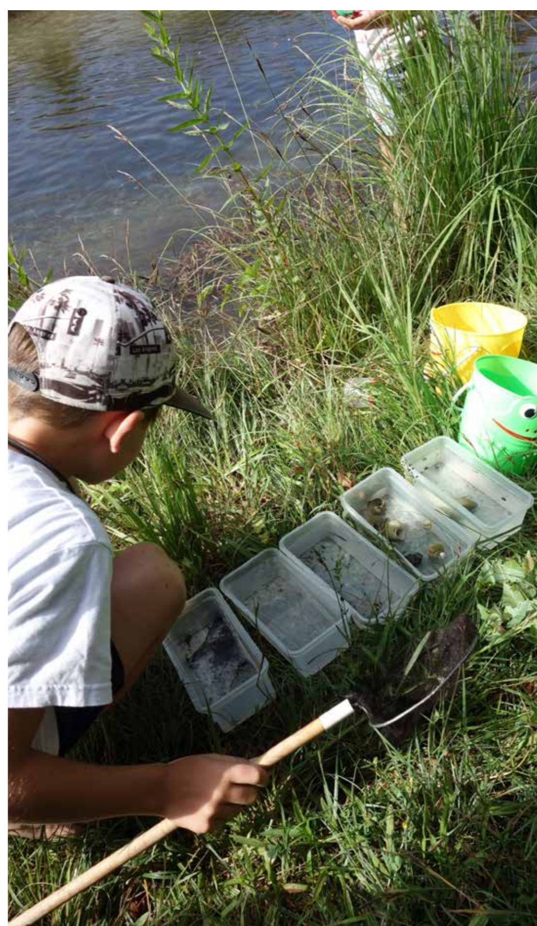
Gewässer, Hecken, Biber – bei uns gibt's immer was Spannendes zu entdecken und zu lernen.